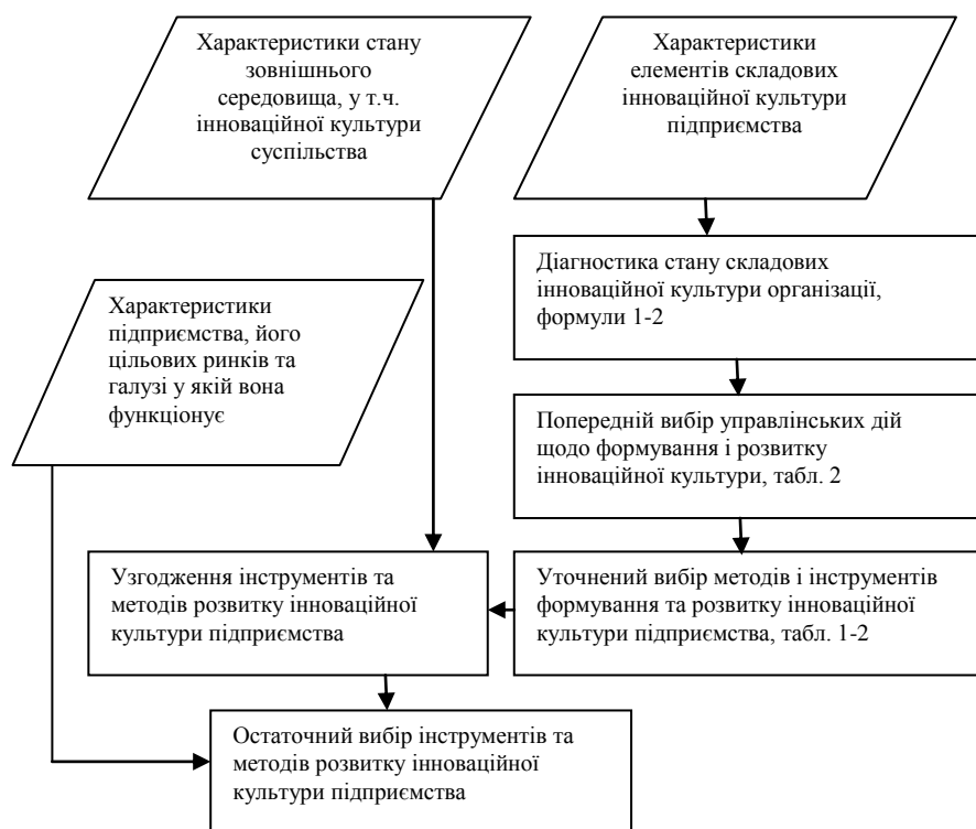
Рис. 2 – Укрупнена графічна інформаційна модель вибору методів та інструментів формування та розвитку інноваційної культури підприємства

Позначення у формулі (4) аналогічні позначенням у формулі (1).