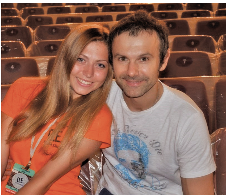
Святослав Вакарчук і Софія – с.5