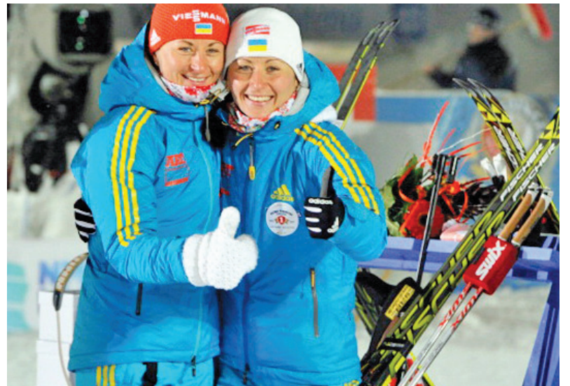
Вітання від чемпіонів – с.8