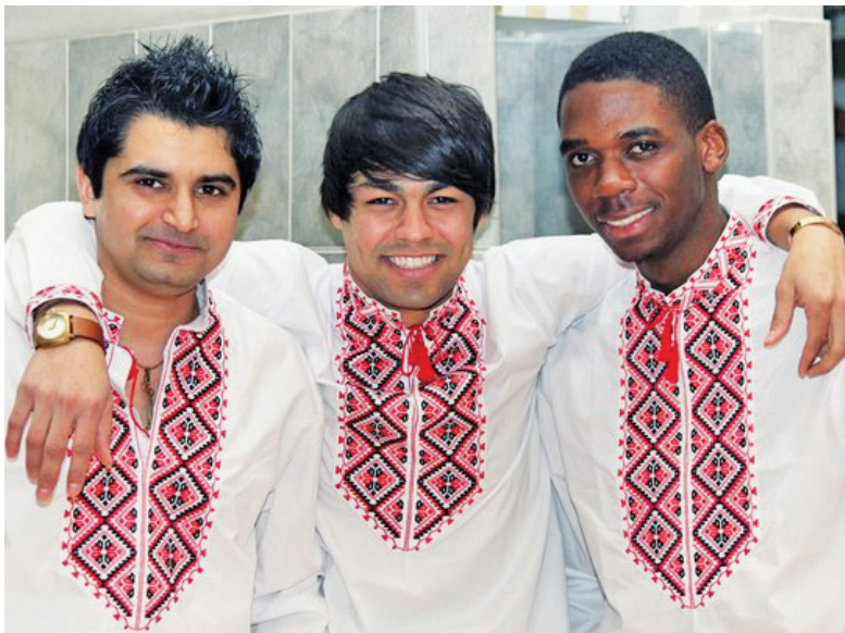
Талант International – с.8