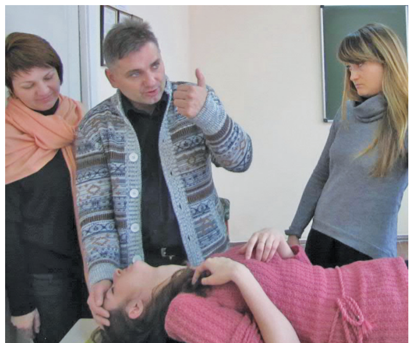
БЖД – с.5