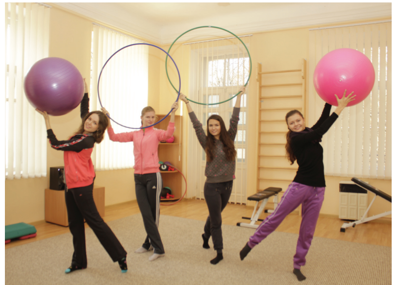
Ескулап – с.2