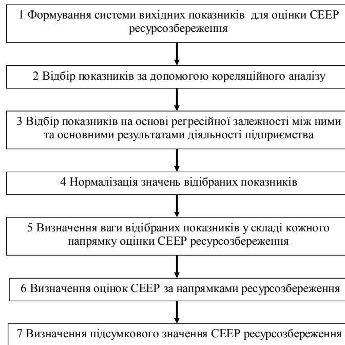
Рис. 1. Етапи визначення комплексної порівняльної оцінки СЕЕР ресурсозбереження на підприємстві

показників не характеризують з достатнім ступенем об'єктивності стан розвитку об'єкта, оскільки вихідна база порівняння показників може бути заниженою.