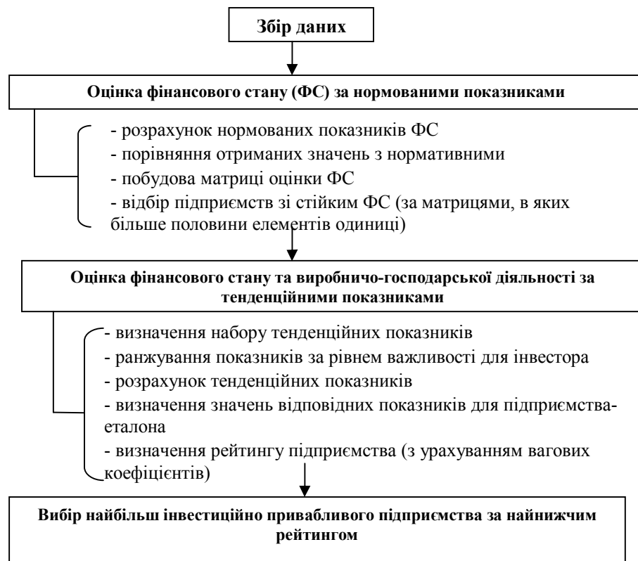
Рис. 2. Алгоритм оцінки інвестиційної привабливості підприємства на основі роздільної оцінки фінансових показників

На першому етапі оцінки проводять порівняння розрахованих значень нормованих показників фінансового стану з їх нормативними значеннями. Результатом такого аналізу має бути матриця оцінки фінансового стану, елементами якої є одиниці або нулі: якщо фактичне значення показника задовольняє нормативному – ставиться одиниця, якщо не задовольняє – нуль.