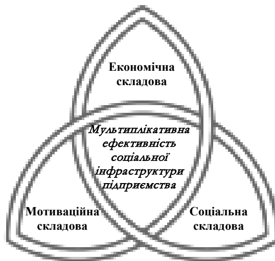
Рис. 1. Трикветр ефективності управління соціальною інфраструктурою промислового підприємства

трьох складових ефективності її функціонування з позицій кожного учасника соціального процесу – власники та керівництво компанії, його працівники та місцева громада (суспільство взагалі). Задоволення інтересів цих трьох цільових груп узагальнюється трьома складовими: економічна, мотиваційна та соціальна відповідно, що в сумі формують мультиплікативну ефективність управління соціальною інфраструктурою промислового підприємства, рис. 1.