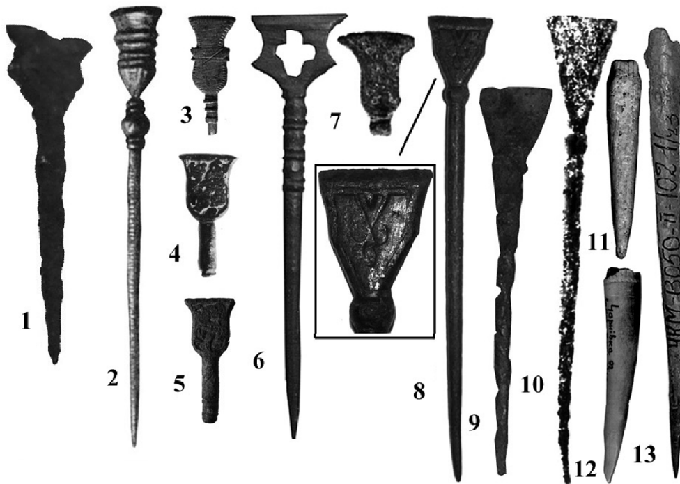
Фото 1. Писала: залізні (1, 4, 5, 7, 9, 10); бронзові (2, 3, 6, 8); кістяні (11-13)

1 - Ленківці на Пруті (2); 2 - Ленківці на Пруті (3); 3 - Володимир (36); 4 - Галич (36); 5 - Ленківці на Пруті (36); 6 - Львів (5); 7 - Володимир (7); 8 - Ленківці на Пруті (9); 9 - Ленківці на Пруті (); 10 - ; Володимир (13); 11 - 12 - Чорнівка; 13 - Ленківці на Пруті