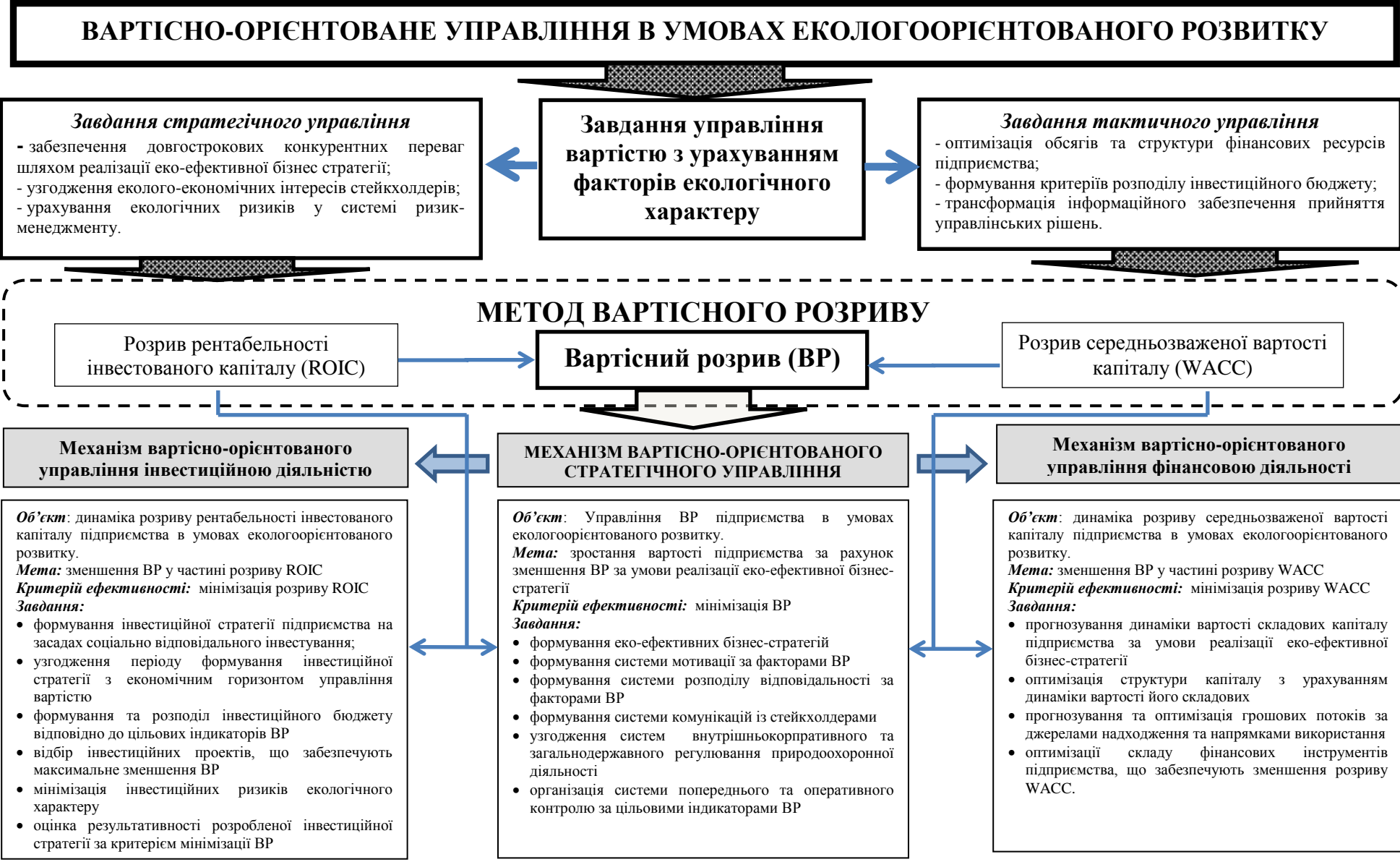
Рис. 2. Роль і місце вартісного розриву в механізмах управління вартістю підприємства в умовах екологоорієнтованого розвитку