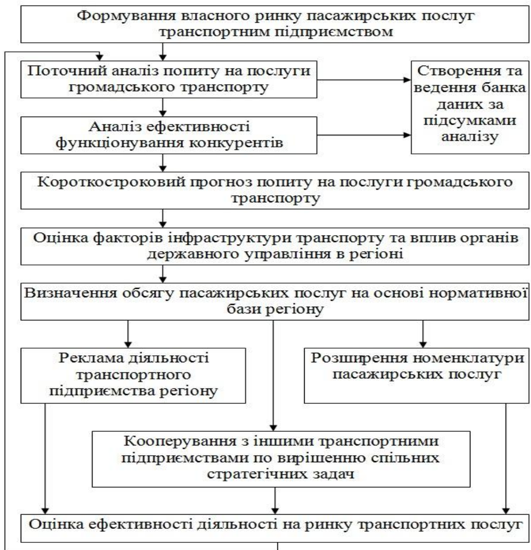
Рис. 2 – Стратегія поведінки транспортних підприємств на ринку пасажирських послуг

Для успішної реалізації розробленої системи стратегічного управління необхідно розв'язати наступні завдання: здійснити моделювання процесу вибору стратегії досягнення оптимального рівня сервісу пасажирських послуг з використанням економіко-математичних методів та розробити прогнозні моделі функціонування певних видів громадського транспорту на регіональному ринку пасажирських послуг на основі використання імітаційного моделювання.