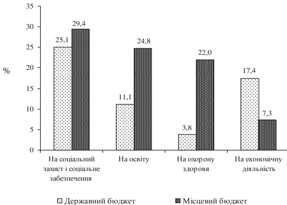
Рис. 1. Питова вага соціальної складової у загальній сумі державних видатків (у середньому за 2007–2011 рр.), % (розроблено за даними [5])