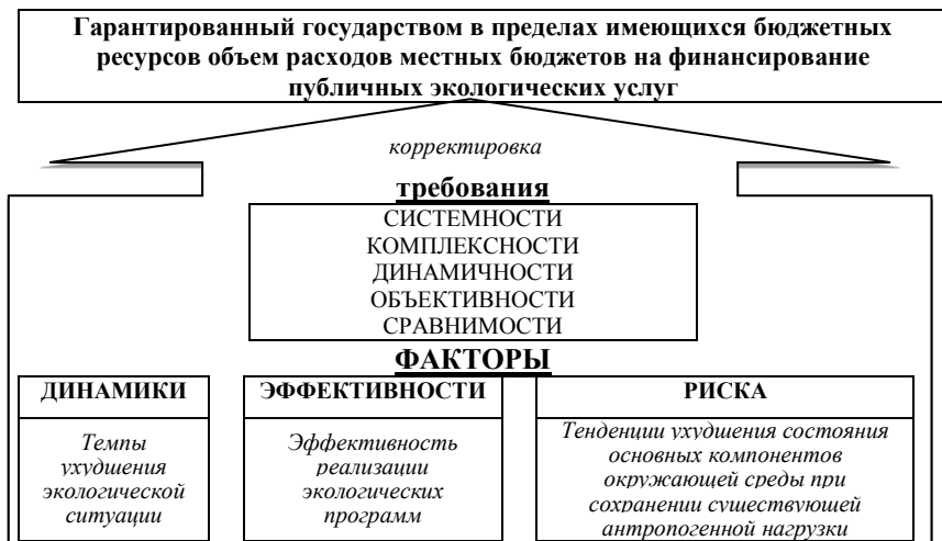
Рис. 2. Влияние факторов динамики, эффективности и риска на определение расчетного объема расходов местных бюджетов на финансирование публичных экологических услуг

Исходя из современного состояния бюджетной системы и понимая объективную ограниченность публичных финансовых ресурсов, считаем целесообразным при определении корректирующих коэффициентов учитывать необходимость лимитирования общего размера средств, направляемых на экологические услуги государственными нормами и стандартами. Таким образом, для распределения средств в соответствии с реальными потребностями и возможностями территорий мы предлагаем определять корректирующие коэффициенты, основываясь на сравнении данных конкретной территории с соответствующими показателями, рассчитанными как средние по всей стране, или же по всей группе территорий. При этом речь может идти о таких однородных по административным признакам группах, как области, районы, территориальные громады городов, сел, поселков и их объединений, предусматривающих единые правила бюджетного планирования, распределения и использования публичных фондов денежных средств. Обозначим такую совокупность через множество территории j .