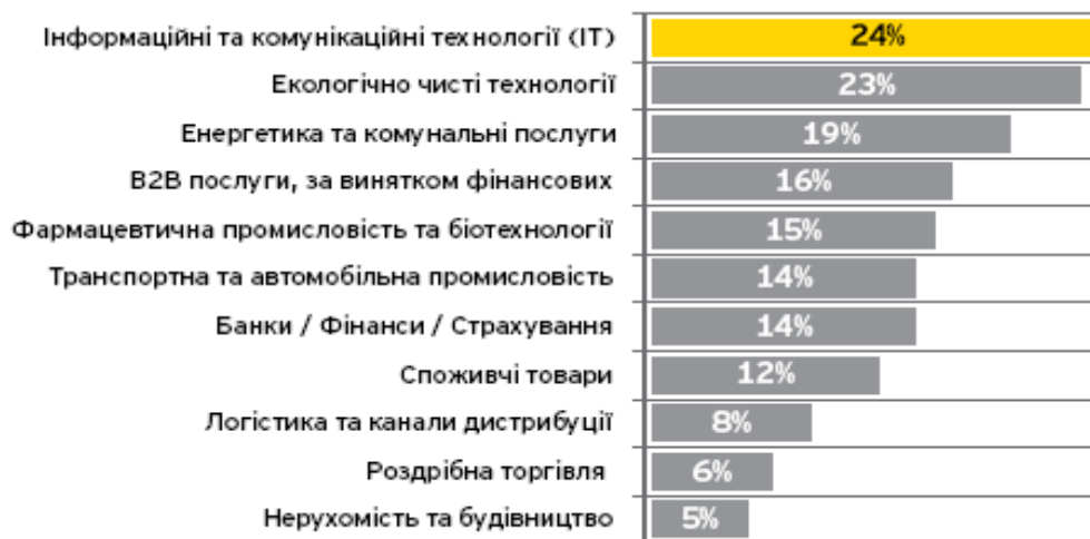
Рис. 2. Бізнес-сектори, що стимулюють зростання європейської економіки

Згідно звіту про прямі іноземні інвестиції в Україну за 2011 р. компанії «Ernst and Young» значне зростання європейської економіки відбувалось завдяки інноваційним галузям, таким як ІТ (24% з них) і екологічно чисті технології (23%). Серед числа опитаних респондентів (усього: 812) увага приділялась також роздрібній торгівлі (6%) як потенційно привабливому бізнес-сектору (рис. 2).