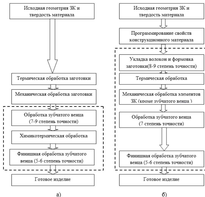
Рис. 1. Технологический процесс изготовления зубчатых колес из металлов (а) и ВПКМ (б)

На следующем этапе технологического процесса, используя информацию о необходимой схеме укладки волокон, выполняется формовка зубчатых колес. Результатом этого этапа являются уже готовые ЗК 8-9 степени точности. Получению более точных колес мешают усадка, коробления и поводки заготовки, возникающие в процессе формовки и термической термообработки. Поэтому для повышения точности ЗК из ВПКМ, также как и металлические ЗК, должны быть подвергнуты обработке резанием на зубообрабатывающем оборудовании. В результате возможно получение ЗК 5-6 степени точности. Вместе с тем выполнение этих технологических операций осложняется низкой стойкостью режущего зуборезного инструмента из-за высокой интенсивности абразивного износа при срезании высокопрочных армирующих волокон ВПКМ.