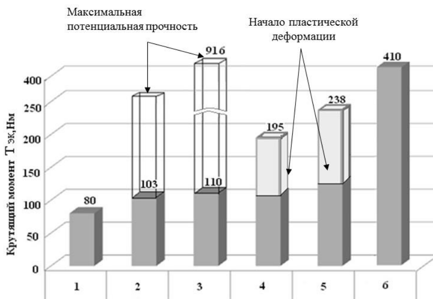
Рис. 4. Разрушающий крутящего момента для зубчатых колес из различных материалов: 1 – флудон; 2 –обработанный углепластик; 3 – углепластик без обработки; 4 – ПОМ; 5 – полиамид; 6 – сталь 45 (180 НВ)