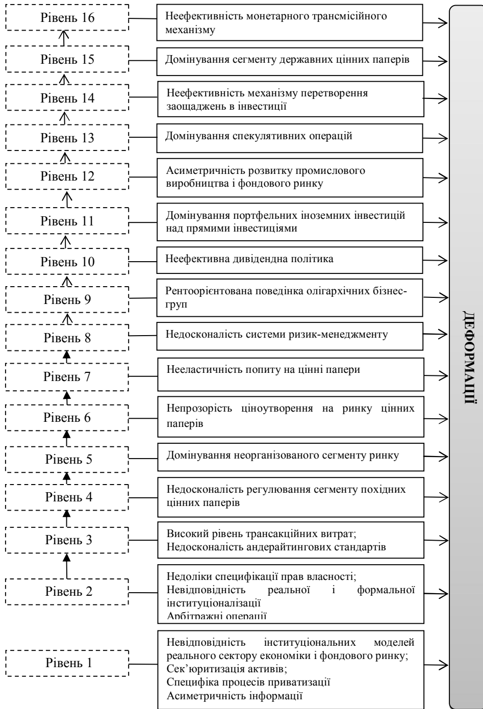
Рис. 2. Модель ієрархії інституційних деформацій фондового ринку України