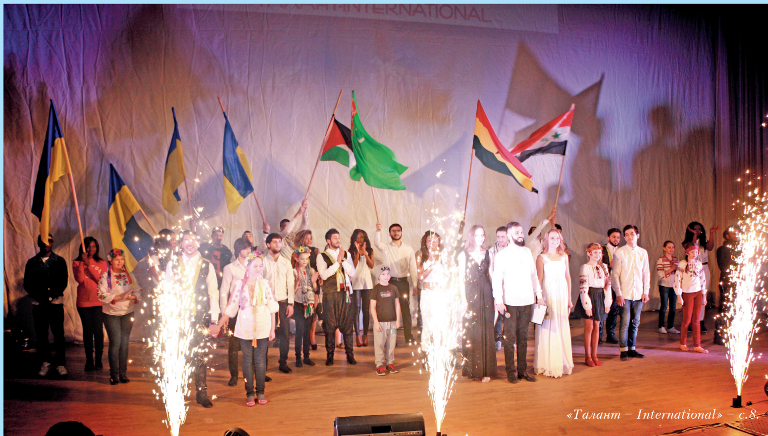
«Талант – International» – с.8.