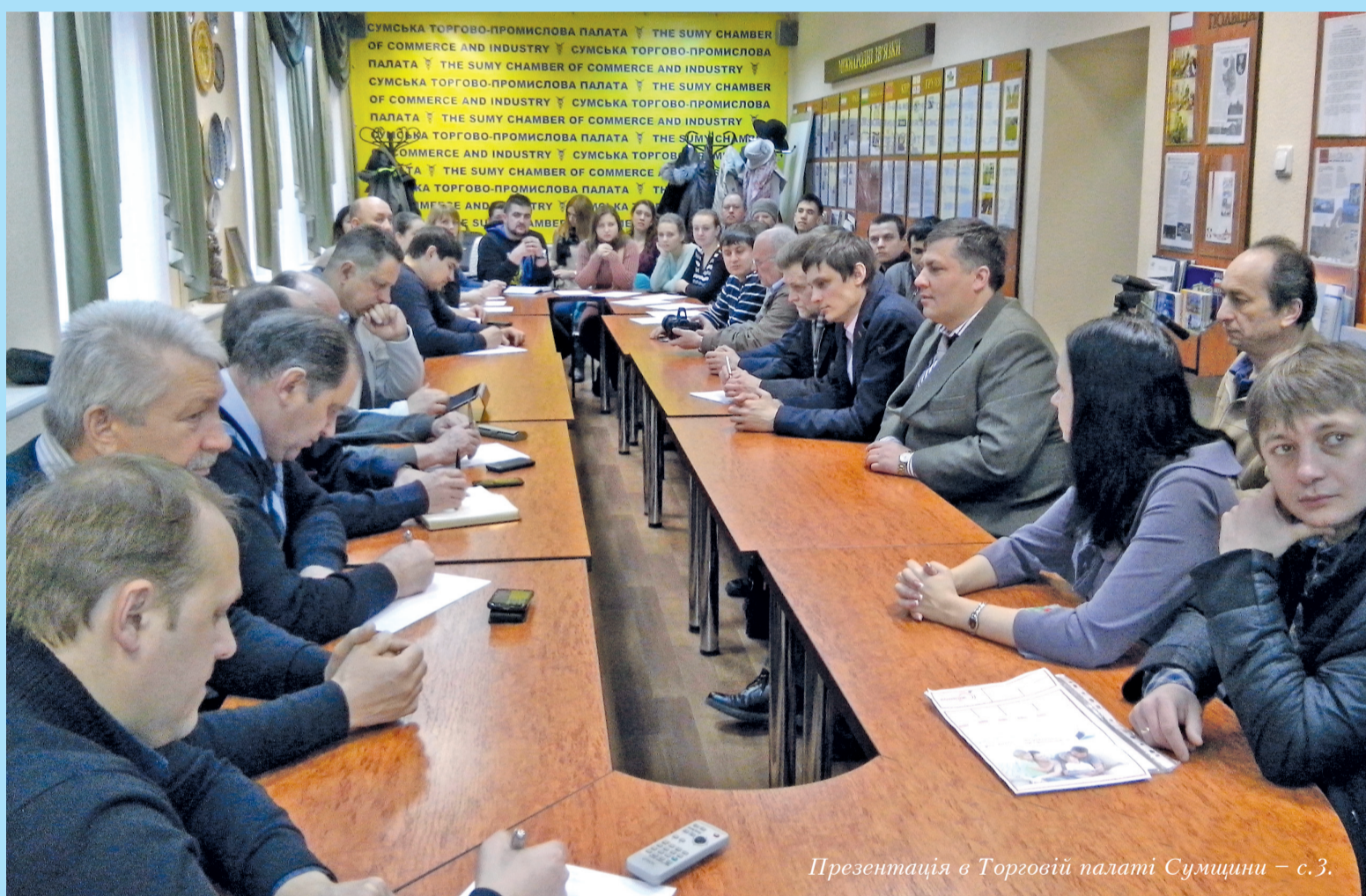
Презентація в Торговій палаті Сумщини – с.3.

На церемонії урочистого відкриття виставки експозицію СумДУ особливо відмітив президент Національної академії педагогічних наук України Василь Кремень , який, будучи ще й президентом Студентської спортивної спілки України, відвідав нещодавно спортивне свято СумДУ «Освіта, спорт, кар'єра», що відбулося з нагоди ювілею університетського спортивного клубу. На думку шановного гостя: «Сумський державний університет уже сьогодні є серед провідних університетів України, а в майбутньому досягне ще більшого, тому що зміни відбуваються в контексті долучення української вищої школи до європейських стандартів...» Прощаючись, він побажав університету продовжувати обраний шлях, досягати ще кращих результатів.