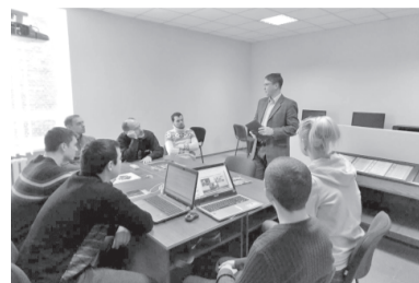
Ознайомлення з обладнанням

Також нещодавно відбулася координаційна зустріч учасників проєкту в університеті