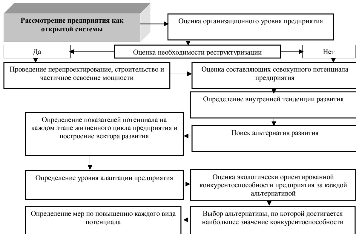
Рисунок 1.2. – Механизм стратегического планирования экологически ориентированной конкурентоспособности предприятия

K_{\text{норм.пропорц.}} , K_{\text{норм.прям.}} , K_{\text{норм.ритм.}} , K_{\text{н.непрер}} – нормативные коэффициенты пропорциональности, прямоточности, параллельности и ритмичности процессов на предприятии.