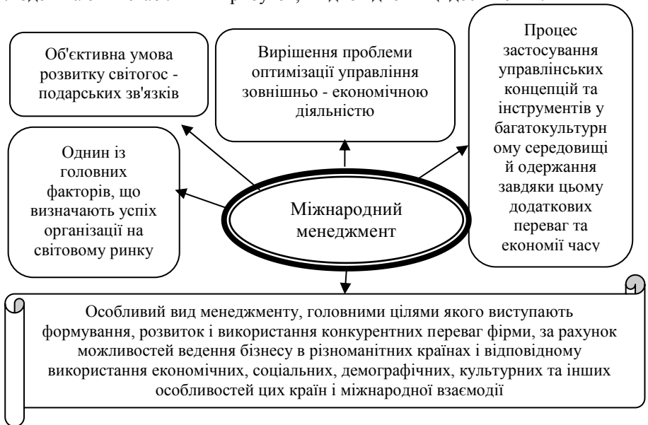
Рис.1. Підходи до визначення міжнародного менеджменту

"хворіють" своєю професією і ходять на роботу, як на свято, але таких працівників можна порахувати на пальцях. Підприємства, які мають таких людей мають і стабільний прибуток, і відповідно вищі досягнення.