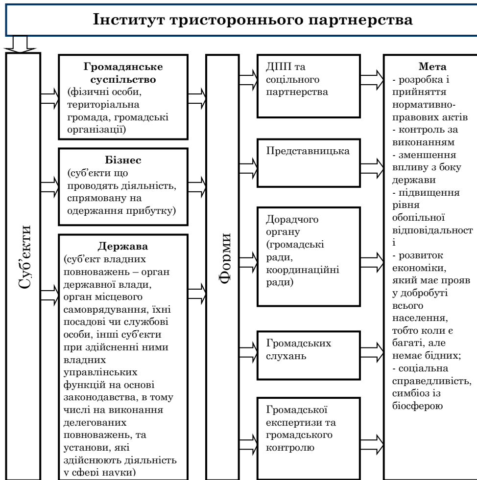
Рисунок 3 - Механізм взаємодії основних суб'єктів економічних відносин тристороннього партнерства

зазначених стосунках не було конкуренції. Об'єднання були створені не за наказом уряду, а через почуття обов'язку перед своїми співгромадянами та країною.