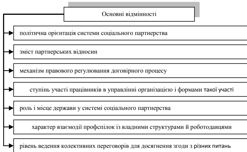
Рис. 2 Основні відмінності національних моделей СП

Вважаємо, що національній моделі СП України притаманні риси трипартизму, згідно з яким регулювання соціально-трудових, економічних і політичних відносин в суспільстві відбувається на основі рівноправної взаємодії та співпраці профспілок, підприємств та держави. Тому варто пам'ятати та очікувати й у подальшому значну участь держави у якості соціального партнера.