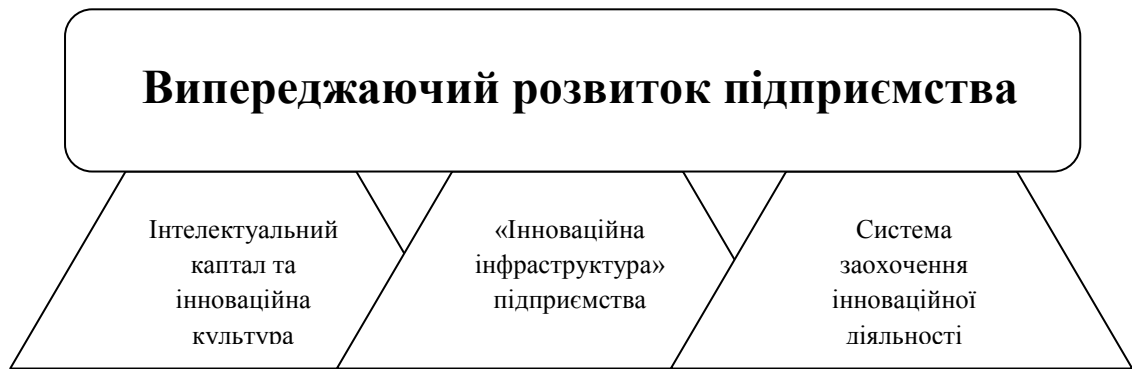
Рисунок 2 – «Три кити» випереджаючого розвитку підприємства

- формування такої організаційної структури, яка б дозволила швидко, реагувати на зміни в зовнішньому середовищі та розвивати інноваційну діяльність на підприємстві. Якщо проводити аналогію з рівнем держави, то таку функцію виконує інноваційна інфраструктура. Тобто керівництво підприємства повинно всіляко сприяти утворенню відділів, які б виконували наступні функції: інформаційне забезпечення інноваційної діяльності та підвищення інформаційного обміну між підрозділами; виробництво інноваційних товарів; сприяння патентуванню, сертифікації, ліцензуванню; активна взаємодія з науковими інститутами та установами, реалізація спільних проектів; фінансове забезпечення інноваційної діяльності.