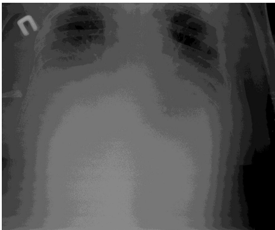
Рисунок 1 – Оглядова рентгенограма. Двобічний синдром плеврального випоту

Під час госпіталізації хворому було виконане променево дослідження ОГК (рис. 1).