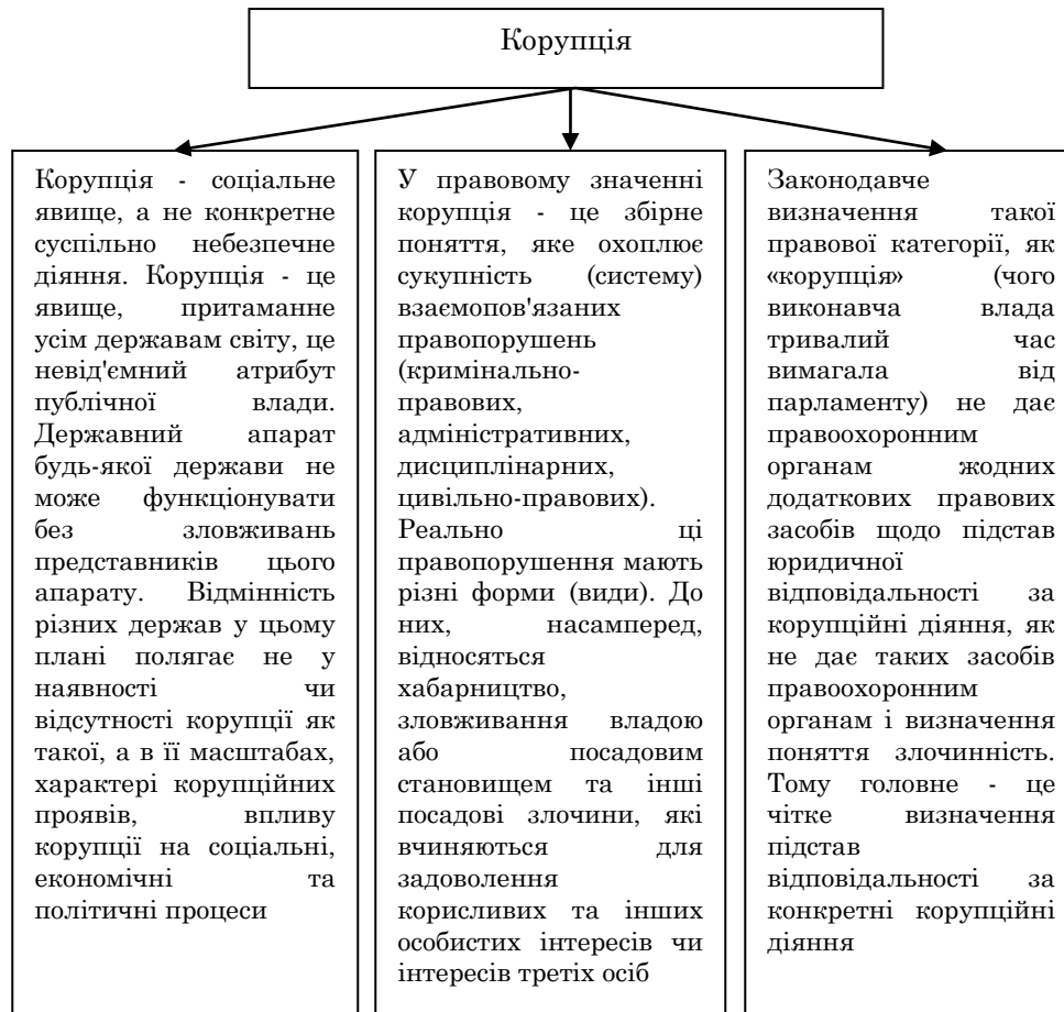
Рисунок 1 – Теоретичні основи визначення поняття «корупція»

Необхідність розробки заходів по боротьбі з корупцією на державній службі, викликана політичними факторами і безліччю внутрішніх і зовнішніх чинників економіки України, таких як недосконала система цільових правових і організаційних заходів по боротьбі з корупцією на державній службі; високий рівень тіньової економіки; необхідність зміцнення своїх позицій в злочинних угрупованнях; вивезення капіталу за кордон і загроза іноземного проникнення в Україну тіньової економіки, в тому числі кримінального капіталу і так далі.