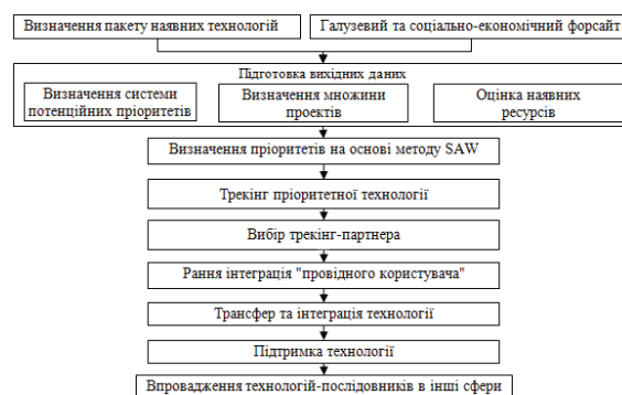
Рис. 2. Механізм вибору космічних технологій для включення у пакет

На основі сучасних методів прийняття рішень [3, 8] нами запропоновано основи алгоритму вибору технологій (рис. 2), що ввійдуть до національного пакету космічних технологій.