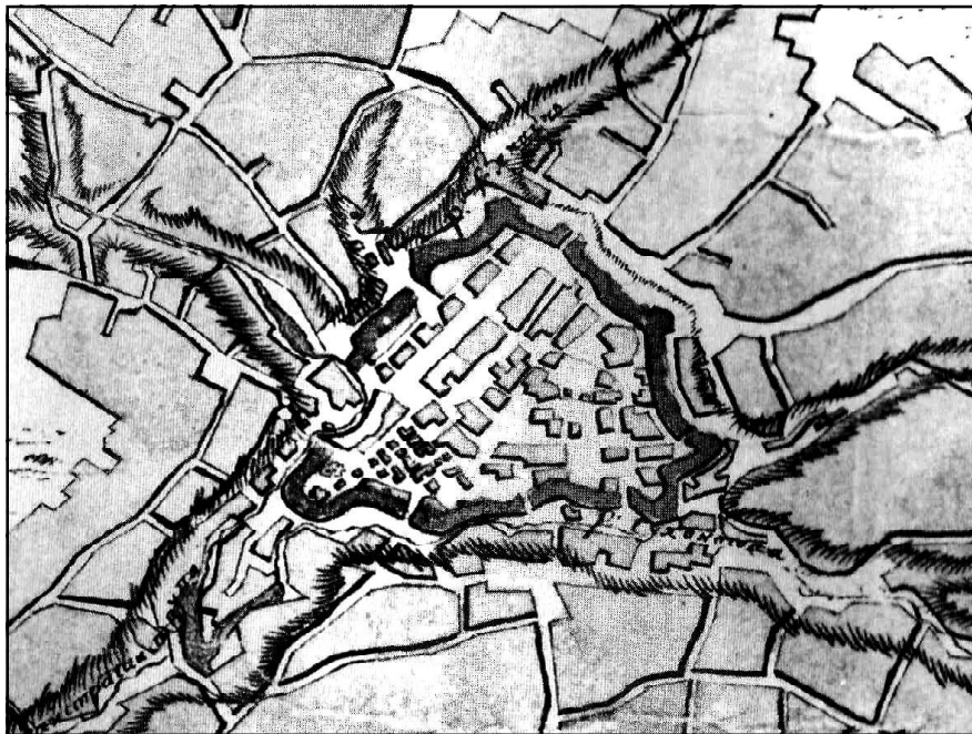
Рис. 3. Фрагмент плану укріплень Березни кінця XVIII ст.

У 1664 р. до Березни підійшло польське військо під командуванням короля Яна II Казимира, яке перед цим штурмом оволоділо невеличкою фортецею Солтикова Дівиця. Ця невеличка фортеця, що була значно меншою від Березни, чинила такий опір і завдала війську короля настільки значних втрат, що Ян Казимір не став штурмувати Березну, яку обороняла березинська сотня козаків сосницького полковника Якова Скидана, а вирушив відразу на Глухів [3, с. 121]