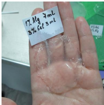
Рисунок 3 – Плівка складу 1% Alg – 3% Gel (співвідношення 7/3)

Плівку складу 1% Alg – 3% Gel (співвідношення 7/3) можливо застосовувати на практиці, але вона є досить лабільною, що ускладнює нанесення та використання з практичної точки зору (рис. 3).