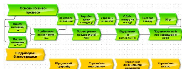
Рисунок 1 – Схема поточних процесів

В результаті аналізу функціонування компанії було розроблено схему, де виділено основні та допоміжні БП (рис.1).