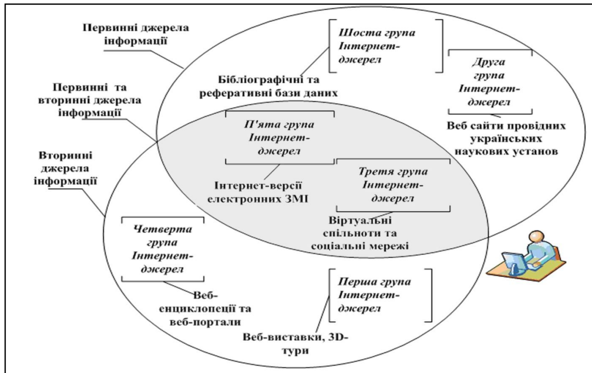
Рис.2. Класифікація за видами наукової інформації в Інтернет-джерелах: первинна та вторинна

З вищезгаданої загальної групи Інтернет-джерел, де знаходиться історична інформація, можна виділити джерела наукової інформації за видами: первинні та вторинні. До первинних належать веб-сайти провідних українських наукових установ, бібліографічні та реферативні бази даних. До вторинних – веб-енциклопедії та веб-портали; веб-виставки, 3-D тури. А такі групи Інтернет-джерел, як віртуальні спільноти та соціальні мережі, Інтернет-версії електронних ЗМІ можна класифікувати за обома видами.