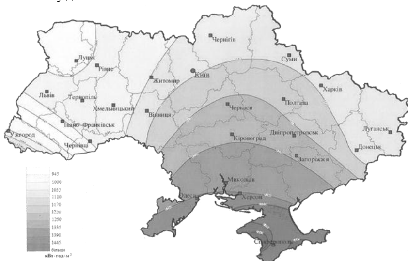
Рис. 1 Розподіл питомої сумарної сонячної радіації в Україні [3]

Умовно територія України поділяється на зони залежно від інтенсивності сонячної радіації (рис. 1). Як видно з рис. 1, більше 50% території знаходяться у II та III зоні. IV зона є найменш придатною для використання сонячної енергії. Але провідними світовими компаніями створено технічні передумови ефективного використання сонячної енергії і у цих зонах, причому не залежно від пори року, погодних умов чи часу доби.