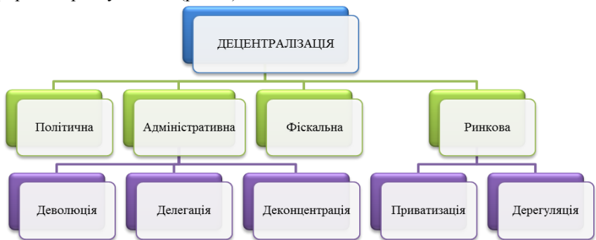
Рис. 1. Форми децентралізації в системі управління природними ресурсами та природокористуванням (складено за [2])

Стандартної моделі децентралізації не існує, форма децентралізації залежить від основних цілей і завдань, а також організаційної структури й механізмів реалізації. Відповідно до цього можливі різні форми децентралізації в системі управління природними ресурсами та природокористуванням (рис. 1).