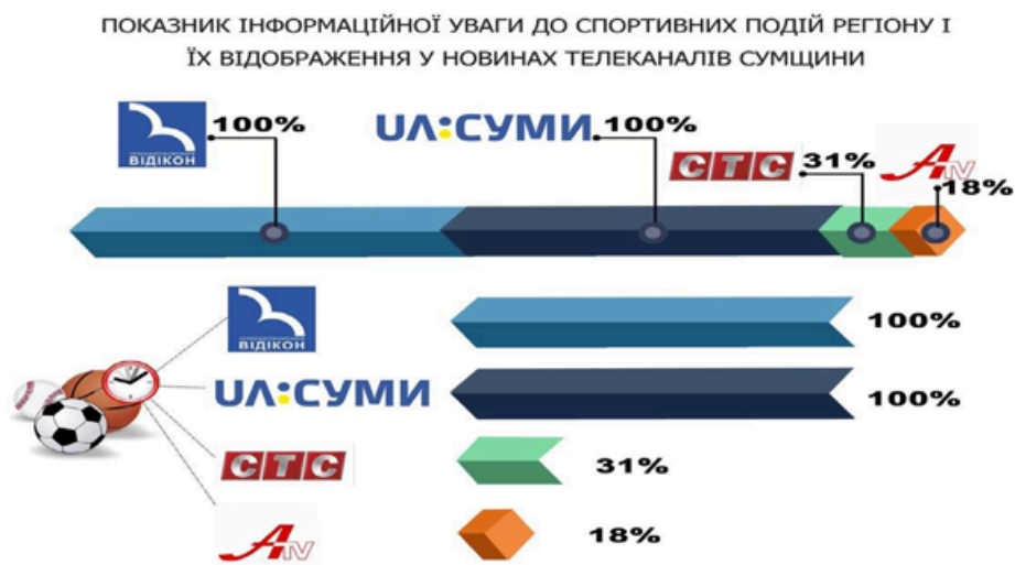
Рис 1. Показник інформаційної уваги до спортивних подій регіону і їх відображення в новинах телеканалів Сумщини

не презентовані на місцевому рівні сюжети, які мають художньо-документальне наповнення. Це стосується, зокрема, замальовки – жанру, що дає можливість ознайомитися з особистісними якостями героя (у нашому випадку – представника спорту).