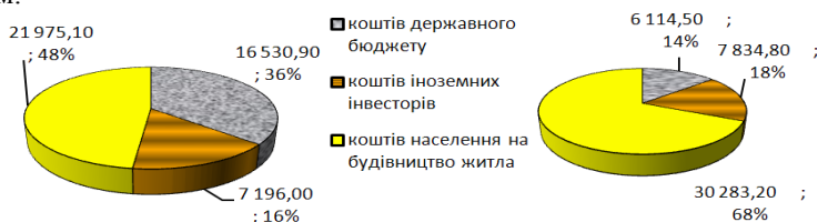
Рис. 2 Структура капітальних інвестицій в будівельну галузь України за джерелами фінансування у 2012 та 2015 роках, млн. грн [1]

Не менш цікавим є дані структури капітальних інвестицій за джерелами фінансування (рис.2). Із наведених даних видно, що у структурі капітальних інвестицій найбільшу частку складають кошти населення, при цьому відбулося збільшення її на 20 п.п. у 2015 р. порівняно з 2012 р., оскільки вкладання коштів у нерухомість характеризується високим ступенем збереження, безпеки і можливістю здійснення постійного контролю інвестором.