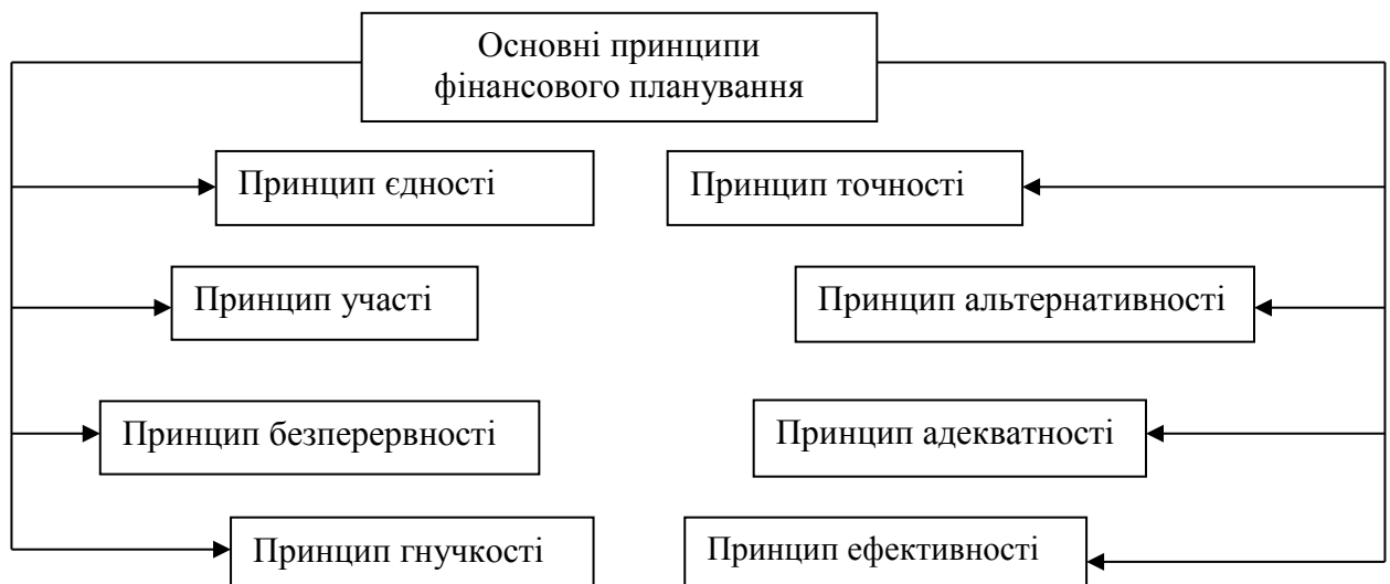
Рисунок 1.3 – Загальні принципи фінансового планування [23]

Принцип єдності (холізму) передбачає системний характер фінансового планування, тобто наявність окремих елементів в системі фінансового планування, взаємозв'язок між ними та спрямованість всіх елементів на досягнення єдиної мети.