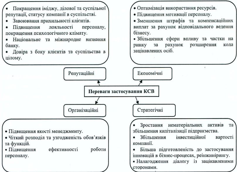
Рисунок 9.3. Переваги застосування концепції корпоративної соціальної відповідальності суб'єктами господарювання в Україні

Варто зазначити, що представлені на рис. 9.3 переваги, які надає КСВ, є орієнтовними та узагальненими для всіх суб'єктів господарювання. Важливо враховувати специфіку та сферу діяльності компанії, коло зацікавлених сторін, а також стан регіону, в якому функціонує підприємство.