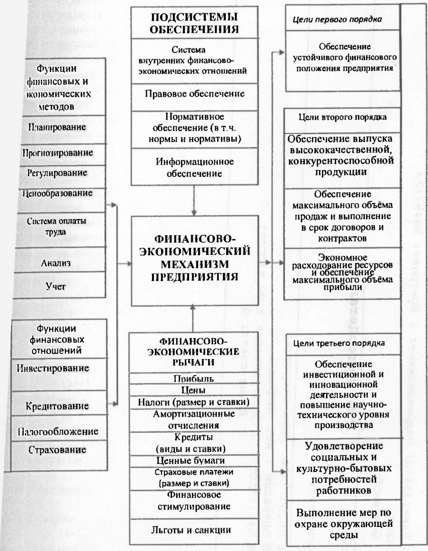
Рис. 4. Функционально-целевая блок-схема построения финансово-экономического механизма предприятия