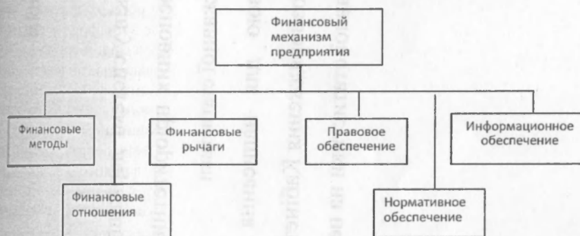
Рис. 3. Структура построения финансового механизма предприятия

Такой же подход необходимо применить и к реформированию финансового и экономического механизмов. С целью более рационального и эффективного управления экономикой и финансами предприятий в условиях рынка эти механизмы должны быть реформированы в единый финансово-экономический механизм предприятия. Для обеспечения его функционирования следует создать на предприятиях единую финансово-экономическую службу под руководством заместителя по экономике и финансам. В сферу её деятельности должны войти: планирование, прогнозирование, система оплаты труда, ценообразование, вопросы налогообложения, технико-экономический анализ производственной деятельности, кредитование, финансирование инвестиций и т.п.