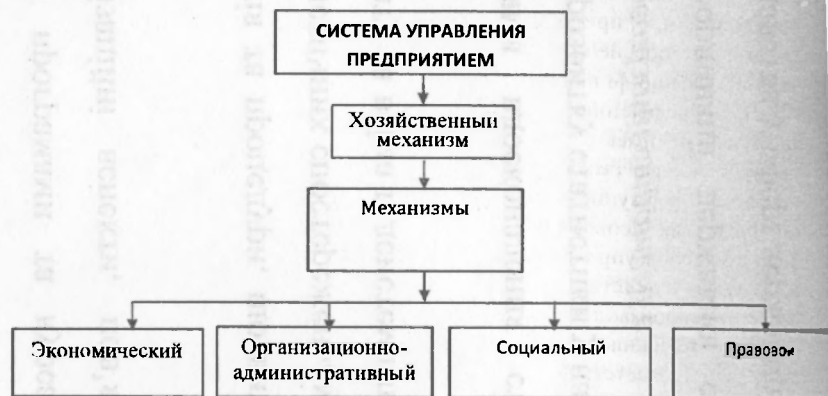
Рис. 2. Схема взаимосвязи системы управления предприятием с хозяйственным механизмом

В тот период финансовый механизм не рассматривался отдельно, так как в экономической системе того времени финансовые отношения действовали очень ограничено. Финансовое планирование и взаимоотношения с бюджетом полностью регулировалось сверху. Д