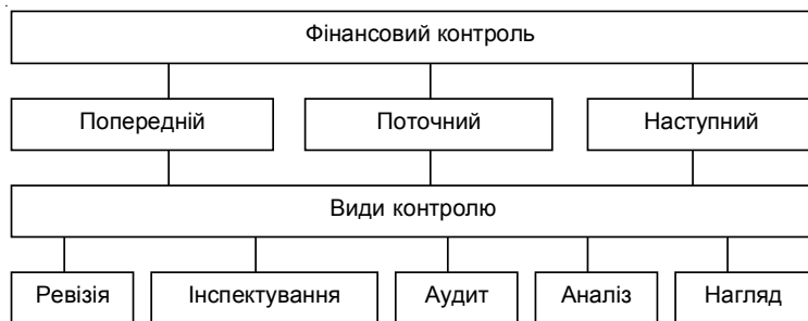
Рис. 1.1. Фінансовий контроль і його види

Отже, фінансовий контроль поділяється на попередній, поточний і наступний. Головним у системі контролю є попередній контроль , мета якого – попередити порушення законів, нецільове використання бюджетних та інших коштів, перекрити шляхи до порушень і крадіжок.