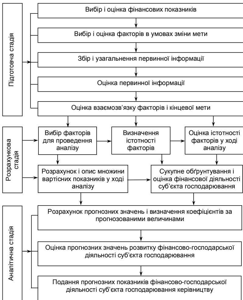
Рис. 1.3. Стадії проведення аналізу фінансово-господарської діяльності суб'єкта господарювання

Отже, для зручності дослідження штучно виділяються окремі господарські процеси і розглядається вплив на них різних господарських факторів для того, щоб наприкінці дослідження розкрити їх взаємозв'язок і вплив на кінцеві результати господарювання.