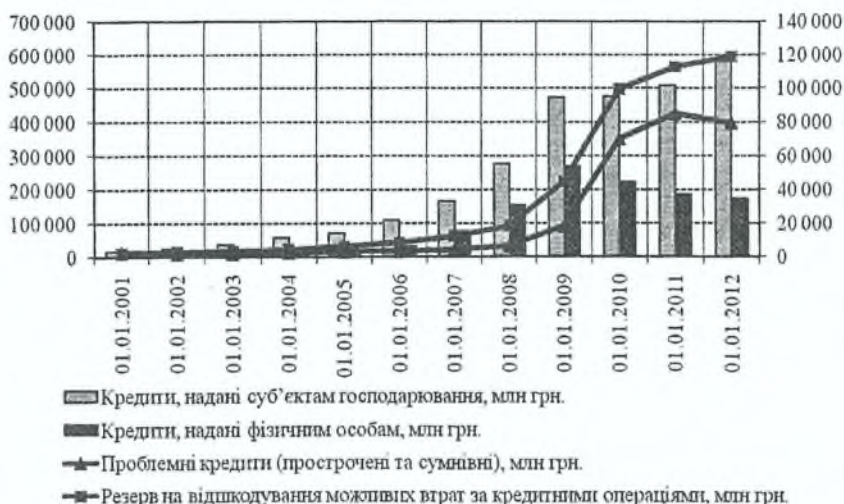
Рис. 4.5.2. Динаміка кредитного портфеля банків України за 2001-2011 роки (станом на початок року) [на основі 3]

Беззаперечним є твердження що у 2001-2005 рр. зовнішні умови функціонування банківської системи України були сприятливими та стимулювали її розвиток, а банки в даний період почали повною мірою виконувати ощадно-капіталотворчу, кредитно-інвестиційну та розрахункові функції.