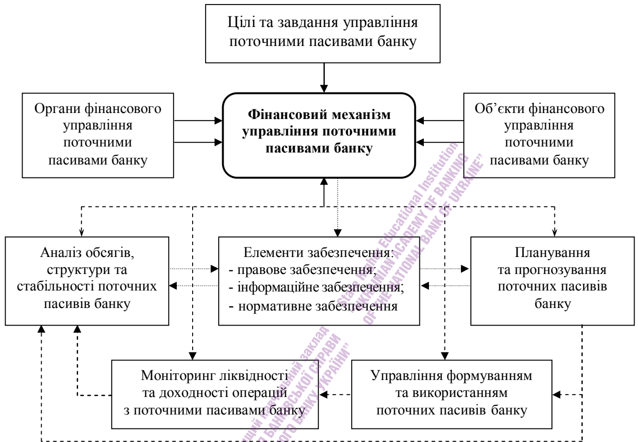
Рис. 1. Основні складові фінансового механізму управління поточними пасивами

На основі цих підходів нами запропонована структурно-функціональна схема побудови фінансового механізму управління поточними пасивами банку, наведена на рис. 1.