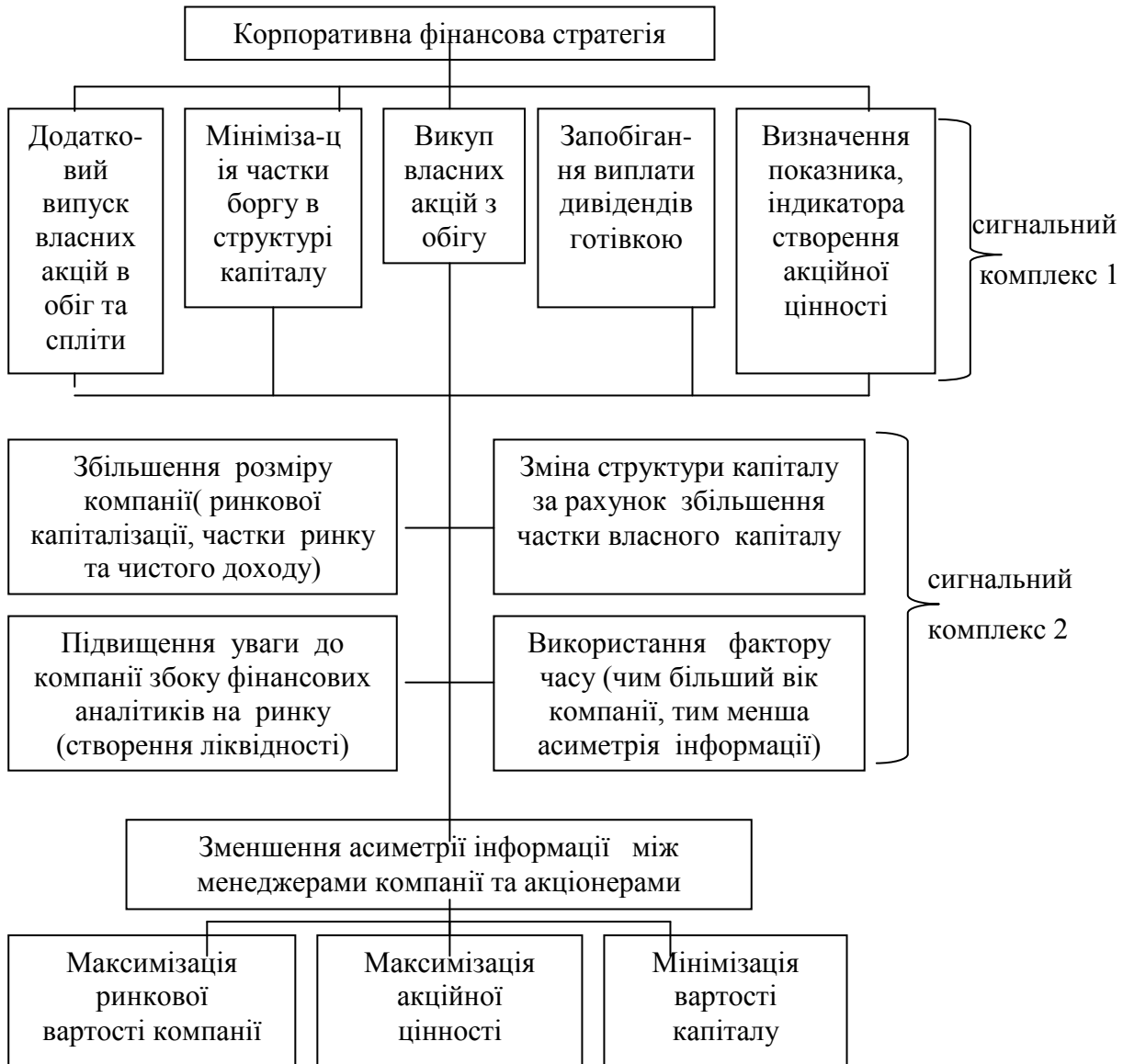
Рис. 1. Двохрівнева корпоративна фінансова стратегія, розроблена на базі двох сигнальних комплексів

В Україні далеко не усі відкриті акціонерні товариства, які вже зробили перший крок у напрямку покращення ефективності менеджменту структури капіталу, тобто зважилися виставити власні акції на біржу, мають такі ж вражаючі досягнення в галузі менеджменту структури капіталу, як лідери світового бізнесу.