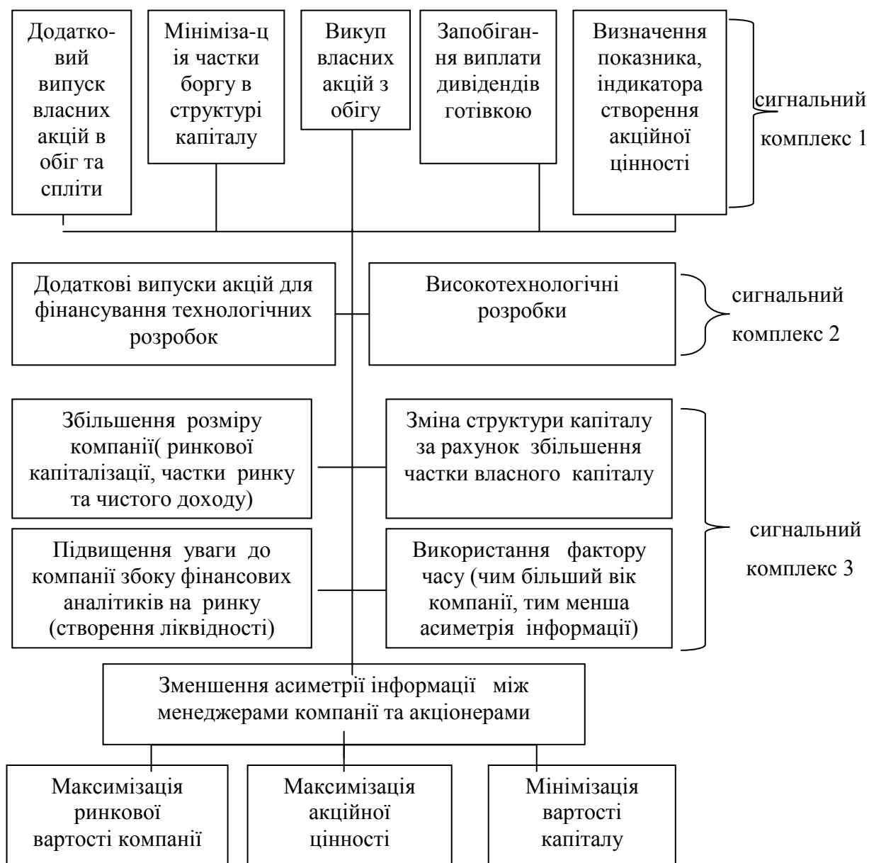
Рис. 2. Трьохрівнева корпоративна фінансова стратегія, розроблена для ВАТ "Інтернафтогазбуд"

Якщо ж рішення на зборах акціонерів не буде прийнято, то більшість належить короткостроковим акціонерам. У такому випадку, підприємству слід перейти до стратегії "б", тобто вдатися до кредиту банку. У даному випадку, головне завдання кредиту банку - примусити неефективних акціонерів покинути підприємство.