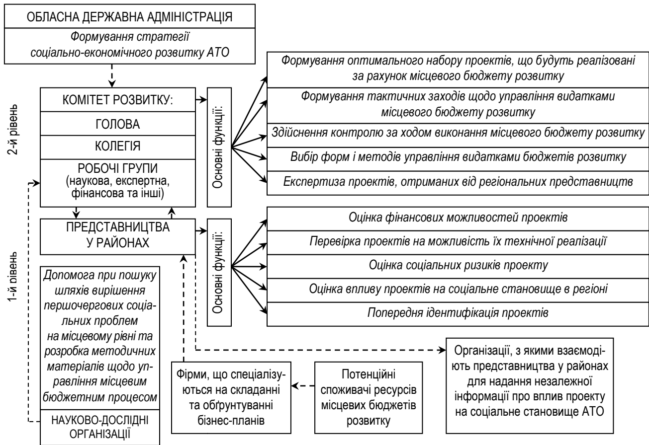
Рис. 2. Дворівнева система управління видатками місцевого бюджету розвитку

наукову, організаційну, фінансову, експертну та інші робочі групи; визначено їх функції та особливості роботи), а прийняття найбільш важливих рішень здійснюється колегією (її функції також конкретизовано в роботі).