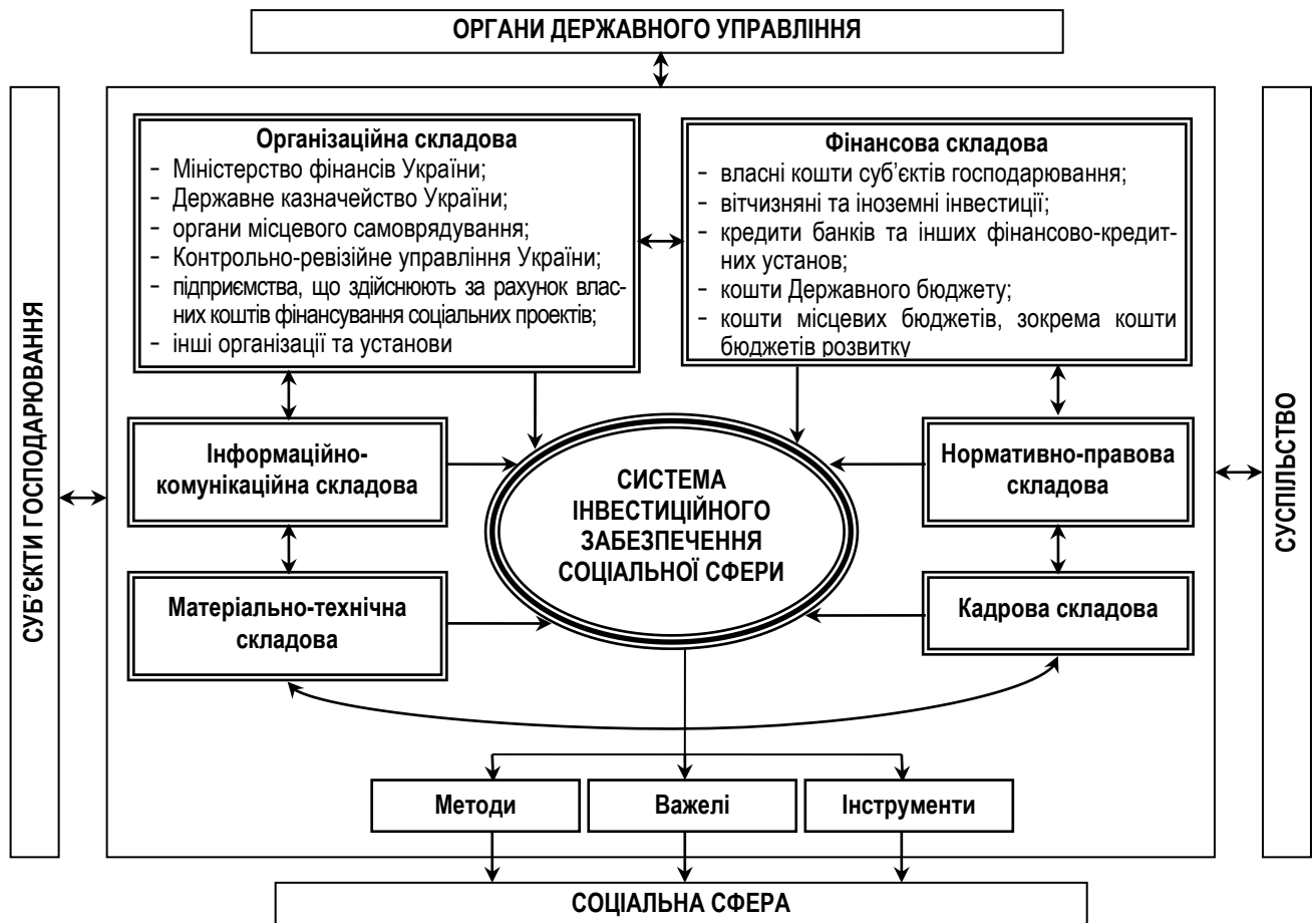
Рис. 1. Система інвестиційного забезпечення соціальної сфери

корисності, збалансованості, структурованості, цілісності, комплексності, відкритості, керованості, пріоритетності, безперервності, відповідності функціональних повноважень, своєчасності, гуманізму.