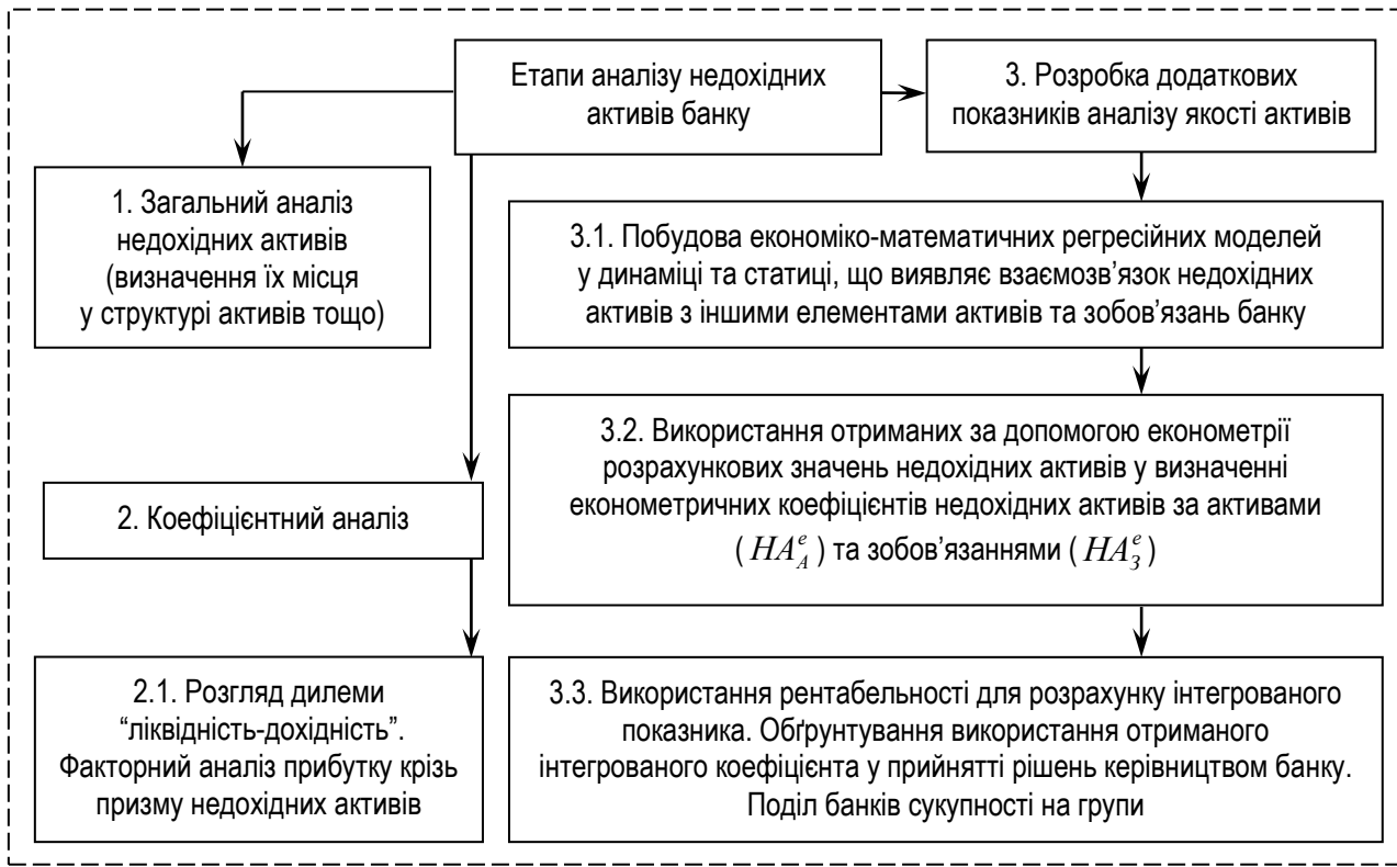
Рис. 2. Схема аналізу недохідних активів банку

розрахунковий коефіцієнт HA_A , а також оптимальний коефіцієнт співвідношення недохідних і дохідних активів (відповідно: HA_{A1opt} , HA_{A2opt} , HA_{A3opt} ).