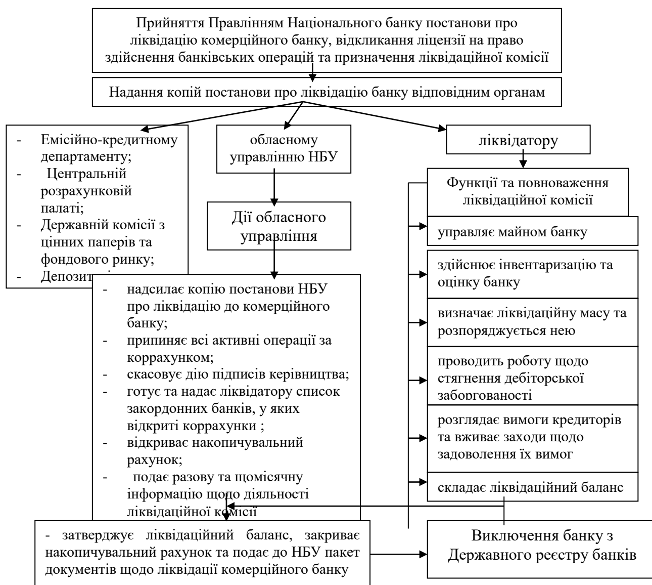
Рис. 2. Схема ліквідації комерційного банку.

може тривати протягом трьох років. Реорганізація банку офіційно відбувається в значно коротші терміни. Однак при цьому слід мати на увазі, що підготовчий період до злиття, пов'язаний з розробкою стратегії та аналізом потенційних кандидатів, може зайняти рік, а то й більше. Певний час потрібен для розробки спільної стратегії, налагодження менеджменту тощо, тобто тривалість обох процесів може бути приблизно однаковою, а соціально-економічні результати будуть суттєво різнитися. Ліквідація навіть одного банку суттєво впливає на загальний стан фінансового ринку, що обумовлює винятковість процедури ліквідації комерційних банків та необхідність виваженого підходу в кожному окремому випадку, використання всіх можливостей максимальної прозорості процесу і згладжування соціальних і економічних наслідків. Узагальнену схему ліквідації комерційного банку наведено на рис. 2.