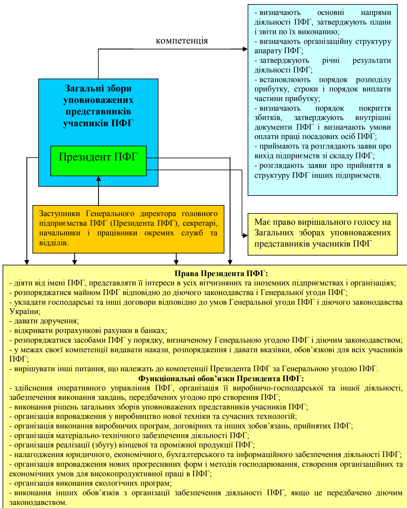
Рис. 2.1. Структура управління ПФГ «Титан»