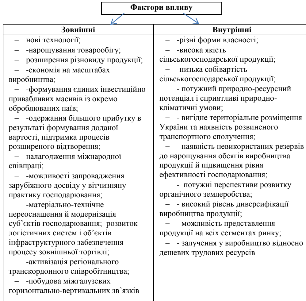
Рисунок 1 – Фактори, які впливають на ефективність управління земельними ресурсами

землекористування, є специфіка природної основи ведення господарської діяльності, особливо в аграрному секторі економіки, розселення населення й урбанізація, рівень соціально-економічного розвитку, економіко-географічного положення. Функціонування механізмів державного управління у сфері земельних відносин залежить від конкретних суспільних умов. Можна виділити основні фактори, які впливають на ефективність управління земельними ресурсами. По зоні впливу усі фактори нами розділено на дві групи: зовнішні та внутрішні що зазначено на рис. 1.