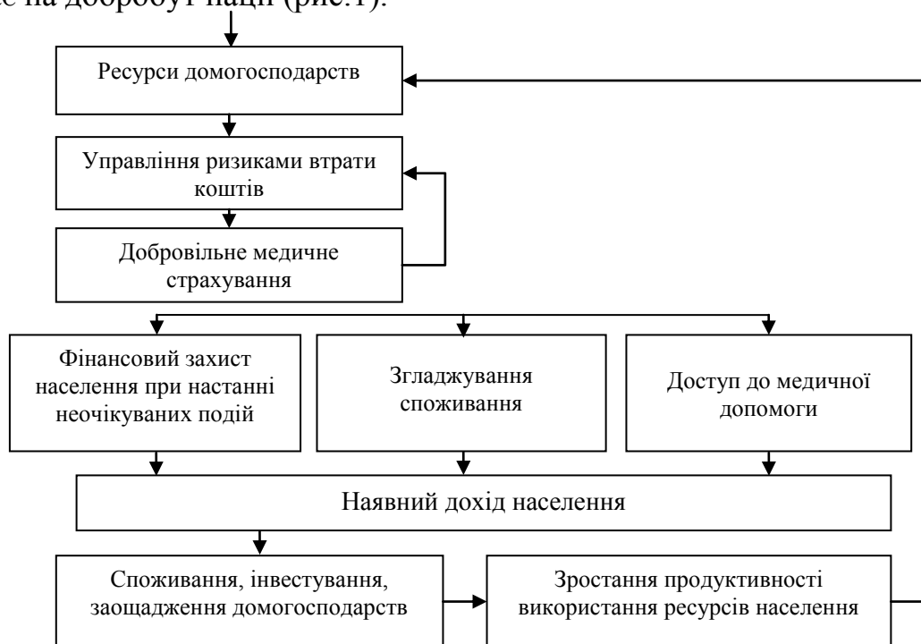
Рисунок 1. Вплив ДМС на економічні процеси [17]

Треба також мати на увазі, що розвиток ДМС в державі не лише забезпечує надання якісних медичних послуг населенню, але і позитивно впливає на добробут нації (рис.1).