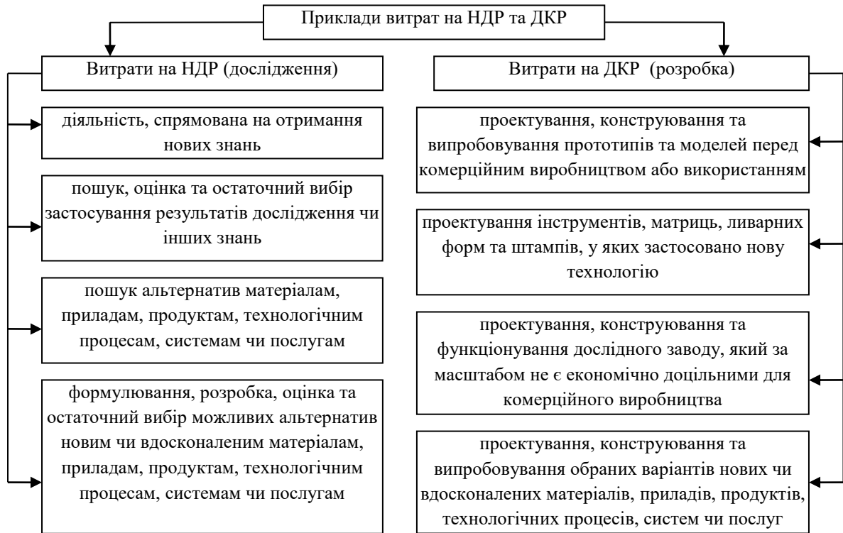
Рис. 1. Розподіл витрат на дослідження і розробки

Якщо суб'єкт господарювання не може виокремити етап дослідження від етапу розробок нематеріального активу, він розглядає видатки на такий проект так, ніби вони були понесені лише на етапі дослідження.