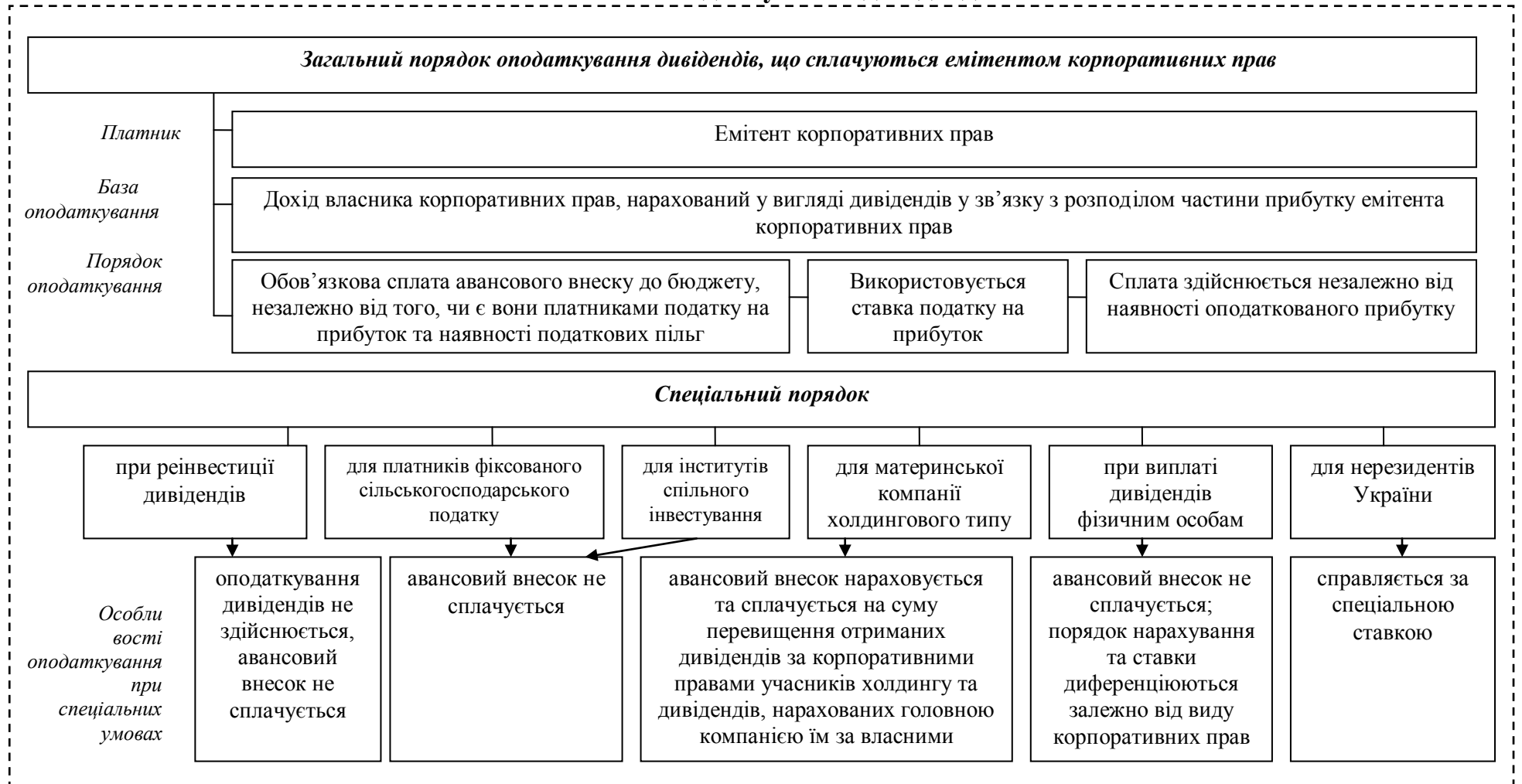
Рис.1. Система оподаткування дивідендів