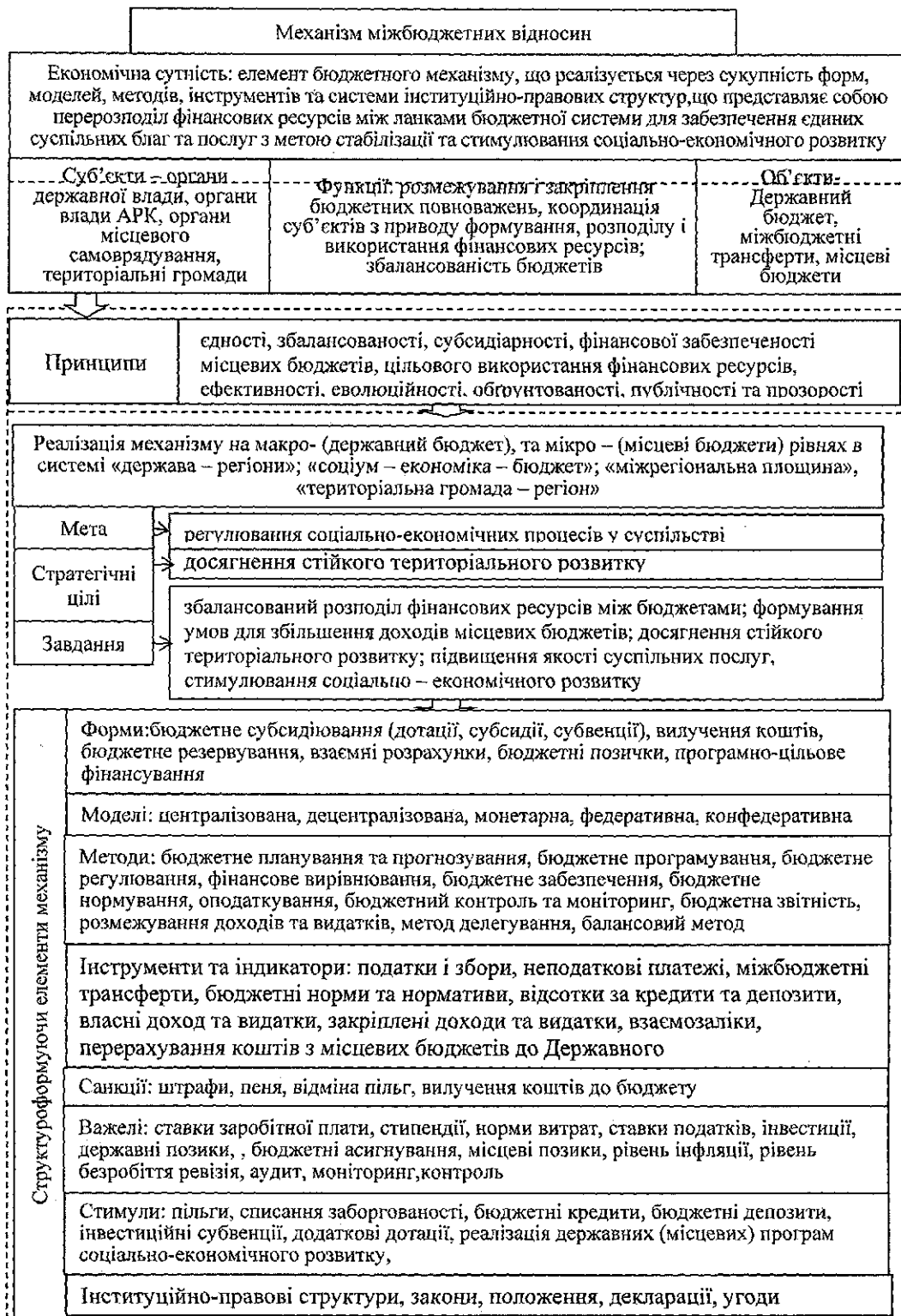
Рис. 1. Концептуальна основа механізму міжбюджетних відносин