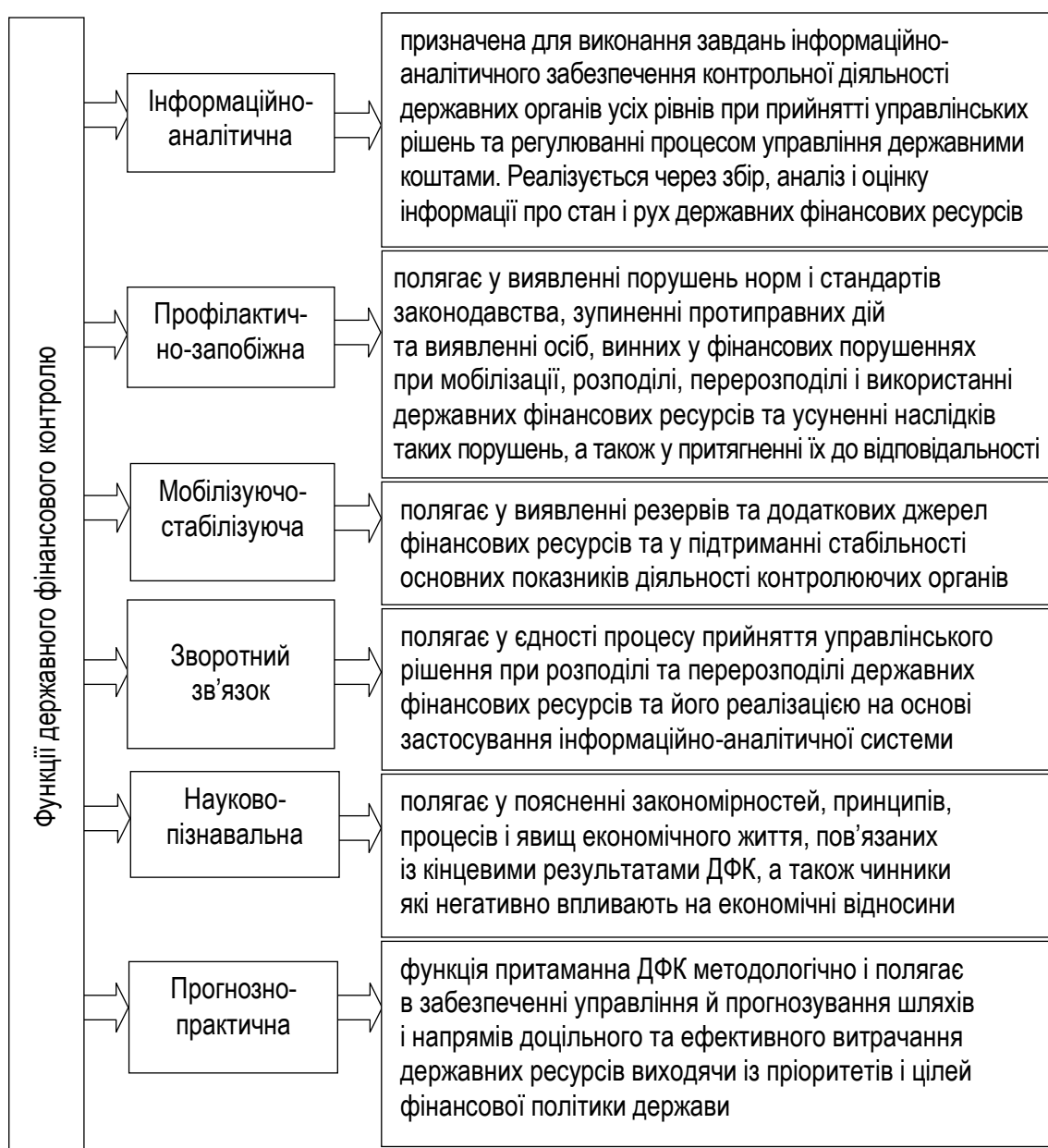
Рис. 2. Узагальнення підходів до змістовного наповнення функцій ДФК

Аналіз підходів вчених до визначення функцій ДФК дозволив виділити і систематизувати такі функції ДФК, як: інформаційно-аналітична; профілактично-запобіжна; мобілізуючо-стабілізуюча функція; функція зворотного зв'язку; науково-пізнавальна функція; прогнозно-практична функція (рис. 2).