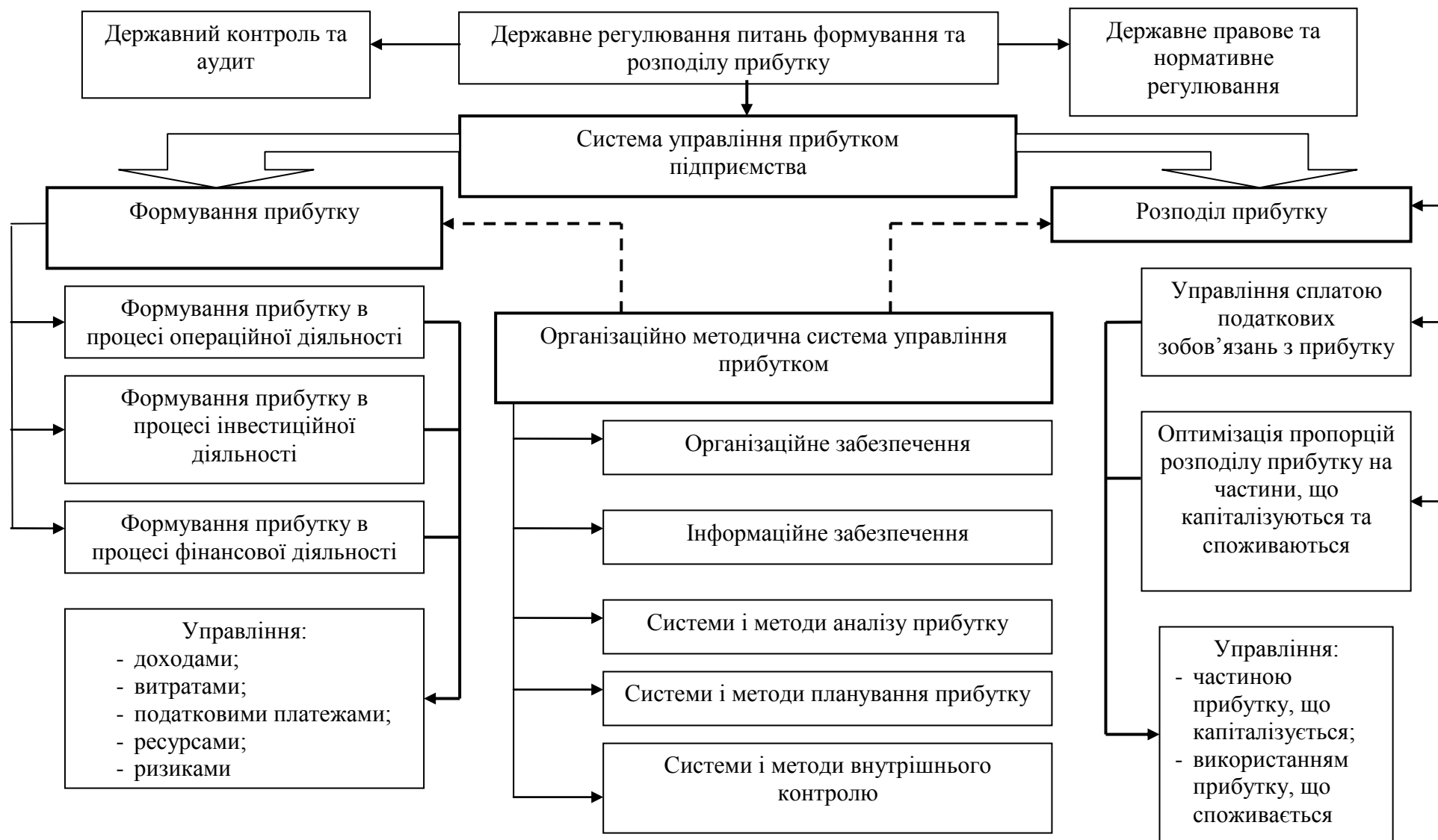
Рис. 2. Структурна схема управління прибутком підприємства