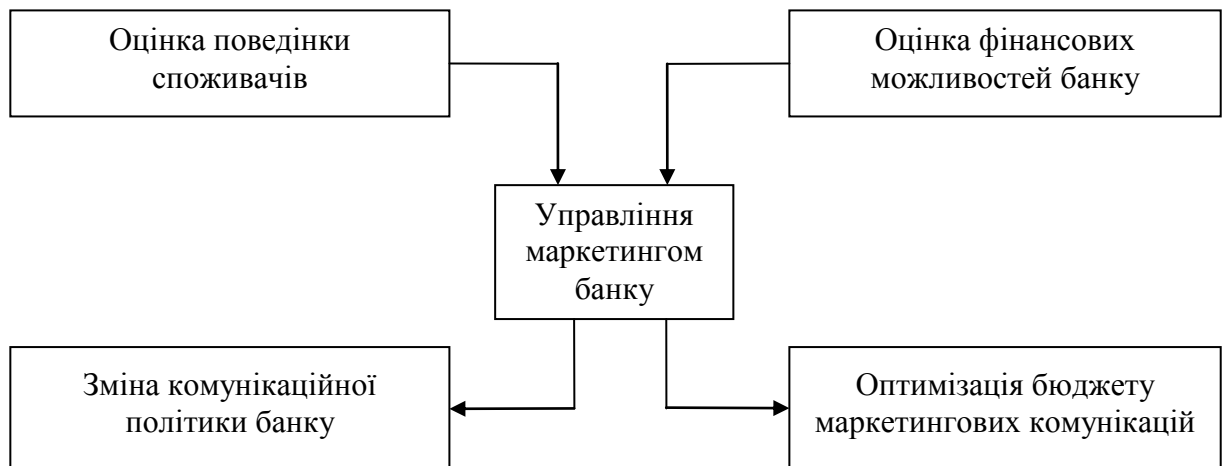
Рис. 1. Напрями діяльності відділу маркетингу банку в умовах фінансової нестабільності

Таким чином, визначимо зв'язок між факторами впливу на маркетингові комунікації банку (поведінка споживачів, фінансові можливості банку) та поведінкою банківського менеджменту.