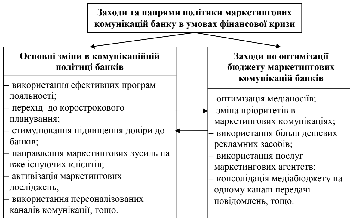
Рис. 3. Основні напрями комунікаційної політики сучасних українських банків

У результаті аналізу політики маркетингових комунікацій банків, було визначено основні заходи та напрями підвищення ефективності банківського маркетингу в умовах фінансової кризи (рис.3).