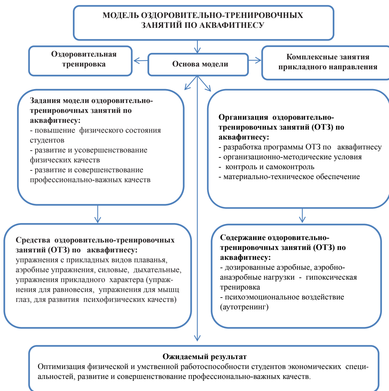
Рис. 1. Структурно-логическая схема модели оздоровительно-тренировочных занятий по аквафитнесу.

Организация исследования. В проведении исследования принимали участие студентки Украинской академии банковского дела Национального банка Украины (далее по тексту УАБД НБУ) и студентки Севастопольского института банковского дела Украинской академии банковского дела Национального банка Украины (далее по тексту СИБД УАБД НБУ). Участницы исследования были разделены на три группы: студентки контрольной группы (КГ, n=24) УАБД НБУ занимались по общепринятой программе; студентки экспериментальной группы 1 (ЭГ-1, n=23) СИБД УАБД НБУ и студентки экспериментальной группы 2 (ЭГ-2, n=22) УАБД НБУ, занимались по разработанной модели занятий по аквафитнесу.