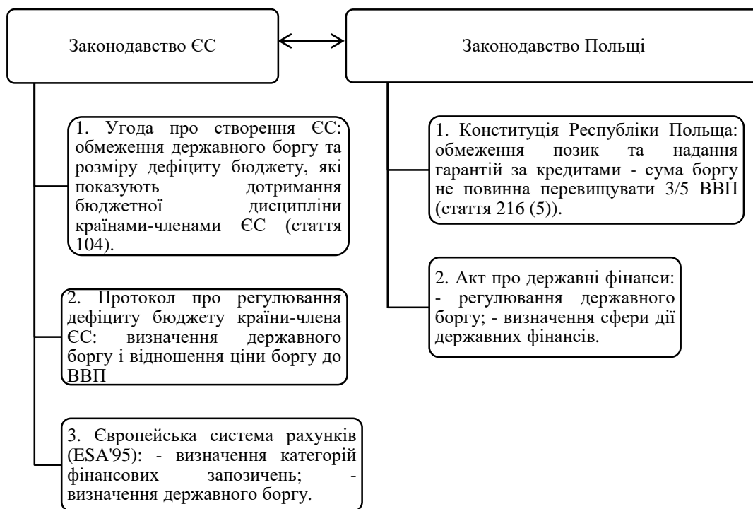
Рисунок 1 – Правове регулювання та забезпечення державних запозичень Польщі

Враховуючи дані, які зазначені на рисунку 1, то дотримання значення показника відношення боргу до ВВП, який повинен не перевищувати рівень 60%, вважається основним критерієм боргової безпеки країни-члена ЄС. Досить важливим є те, що законодавство Польщі повністю у сфері державного боргу адаптоване до вимог європейського законодавства.